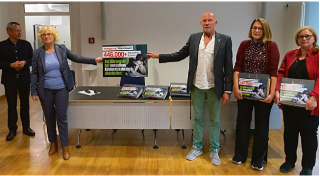
Übergabe von mehr als 446.000 Unterschriften zur Abschaffung der Verjährungsfrist bei sexuellem Kindesmissbrauch am 29.06.2020 an Bundesjustizministerin Frau Christine Lambrecht